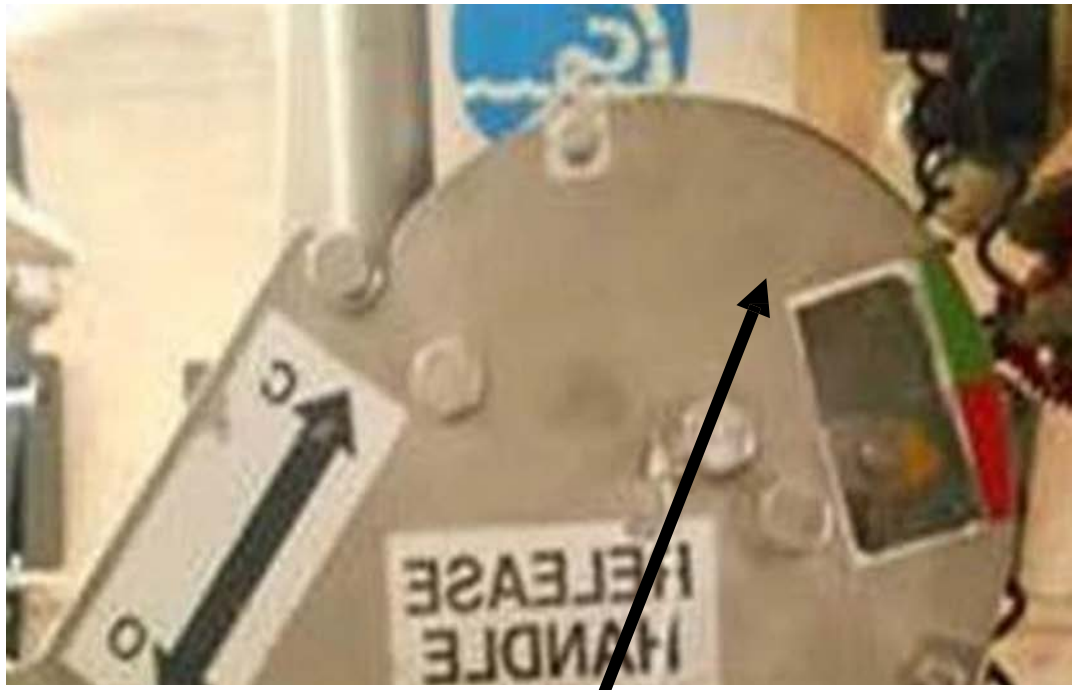
Position indicator reversed